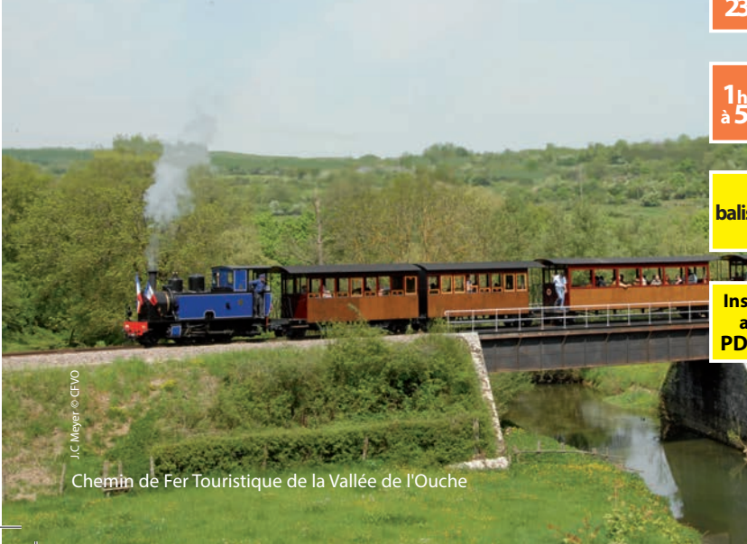
J.C. Meyer © CEVO