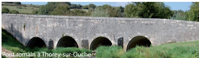
Pont romain à Thorey-sur-Ouche