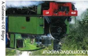
Locomotive vapeur A. Galosseau

Renseignements pratiques Liste des hébergements, restaurants et commerces à l'Office de Tourisme du Canton de Bligny-sur-Ouche et sur le site : www.ot-cantonde-blignysurouche.fr