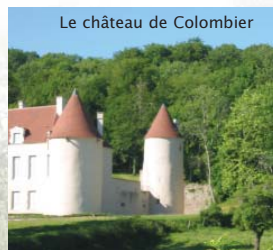
Le château de Colombier