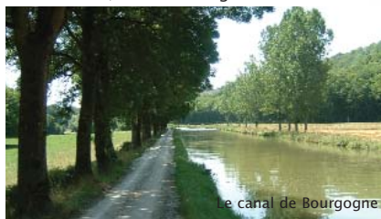
le canal de Bourgogne

© IGN - PARIS 2005 (fond cartographique) Réalisé par l'Institut Géographique National. IGN - Agence Régionale Bourgogne Franche-Comté Parc d'Affaires de Crécy - St, rue Claude Chappe 69771 SAINT-DIDIER-AU-MONT D'OR Cedex © Côte-d'Or Tourisme 2005 - DIJON (surcharges thématiques) Cofinancé par Côte-d'Or Tourisme et la Communauté de Communes de Bligny-sur-Ouche.